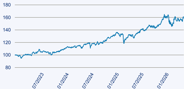
— JPM Middle East, Africa and Emerging Europe Opportunities A Acc EUR

Risiko: Die in der Vergangenheit erzielte Performance und die Erträge lassen keinen Rückschluss auf die zukünftige Performance und die Erträge des Fonds zu. Der Fonds ist weder mit einer Garantie noch mit einem Kapitalschutzmechanismus ausgestattet. Der in Euro umgerechnete Wert internationaler Anlagen des Fonds kann infolge von Wechselkursschwankungen (Währungsschwankungen) sowohl steigen als auch sinken. Der Wert des Fonds und damit der Wert ihres Investments kann gegenüber dem Einstandspreis steigen oder fallen.