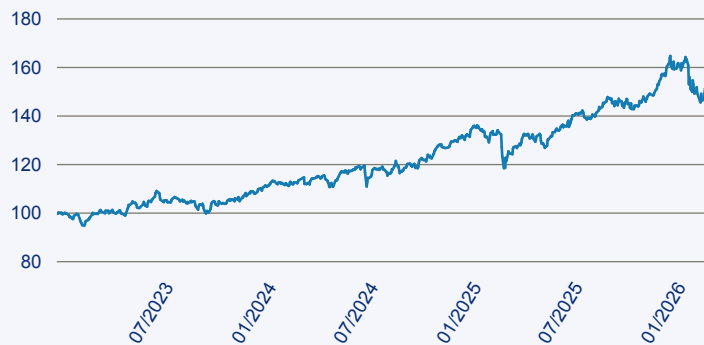
— JPM Middle East, Africa and Emerging Europe Opportunities A Acc EUR

Risiko: Die in der Vergangenheit erzielte Performance und die Erträge lassen keinen Rückschluss auf die zukünftige Performance und die Erträge des Fonds zu. Der Fonds ist weder mit einer Garantie noch mit einem Kapitalschutzmechanismus ausgestattet. Der in Euro umgerechnete Wert internationaler Anlagen des Fonds kann infolge von Wechselkursschwankungen (Währungsschwankungen) sowohl steigen als auch sinken. Der Wert des Fonds und damit der Wert ihres Investments kann gegenüber dem Einstandspreis steigen oder fallen.