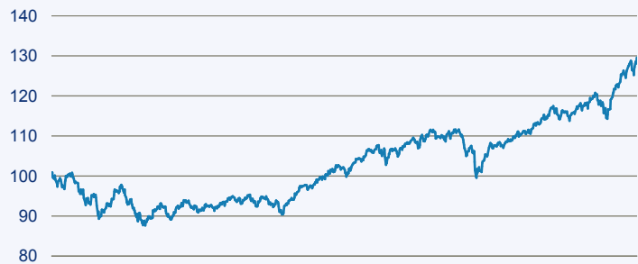
— Swisscanto (LU) Portfolio Fund - Sustainable Balanced (EUR) DT

Risiko: Die in der Vergangenheit erzielte Performance und die Erträge lassen keinen Rückschluss auf die zukünftige Performance und die Erträge des Fonds zu. Der Fonds ist weder mit einer Garantie noch mit einem Kapitalschutzmechanismus ausgestattet. Der in Euro umgerechnete Wert internationaler Anlagen des Fonds kann infolge von Wechselkursschwankungen (Währungsschwankungen) sowohl steigen als auch sinken. Der Wert des Fonds und damit der Wert ihres Investments kann gegenüber dem Einstandspreis steigen oder fallen.