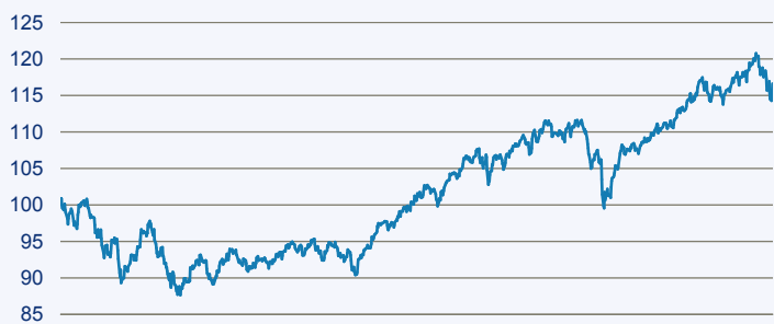
— Swisscanto (LU) Portfolio Fund - Sustainable Balanced (EUR) DT

Risiko: Die in der Vergangenheit erzielte Performance und die Erträge lassen keinen Rückschluss auf die zukünftige Performance und die Erträge des Fonds zu. Der Fonds ist weder mit einer Garantie noch mit einem Kapitalschutzmechanismus ausgestattet. Der in Euro umgerechnete Wert internationaler Anlagen des Fonds kann infolge von Wechselkursschwankungen (Währungsschwankungen) sowohl steigen als auch sinken. Der Wert des Fonds und damit der Wert ihres Investments kann gegenüber dem Einstandspreis steigen oder fallen.