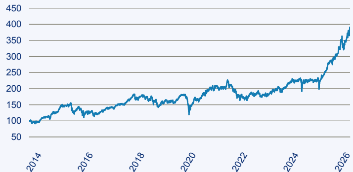
abrdrn SICAV I - Japanese Smaller Companies Sustainable Equity X Acc Hedged E

Risiko: Die in der Vergangenheit erzielte Performance und die Ertrage lassen keinen Ruckschluss auf die zukunftliche Performance und die Ertrage des Fonds zu. Der Fonds ist weder mit einer Garantie noch mit einem Kapitalschutzmechanismus ausgestattet. Der in Euro umgerechnete Wert internationaler Anlagen des Fonds kann infolge von Wechselkursschwankungen (Wahrungsschwankungen) sowohl steigen als auch sinken. Der Wert des Fonds und damit der Wert ihres Investments kann gegenuber dem Einstandspreis steigen oder fallen.