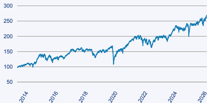
— Janus Henderson Horizon Fund - Pan European Mid and Large Cap Fund A2 EUR

Risiko: Die in der Vergangenheit erzielte Performance und die Ertrage lassen keinen Ruckschluss auf die zukunftige Performance und die Ertrage des Fonds zu. Der Fonds ist weder mit einer Garantie noch mit einem Kapitalschutzmechanismus ausgestattet. Der in Euro umgerechnete Wert internationaler Anlagen des Fonds kann infolge von Wechselkursschwankungen (Wahrungsschwankungen) sowohl steigen als auch sinken. Der Wert des Fonds und damit der Wert ihres Investments kann gegenuber dem Einstandspreis steigen oder fallen.