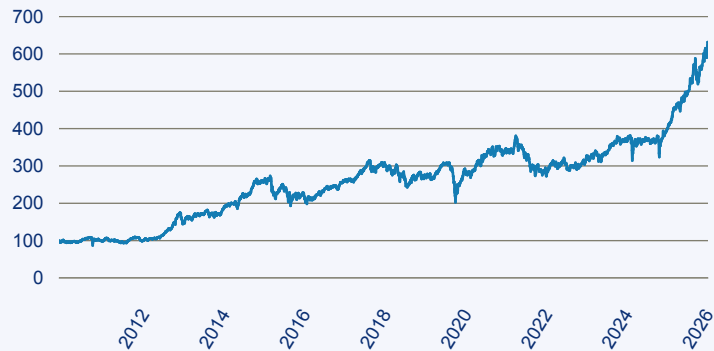
abrdrn SICAV I - Japanese Smaller Companies Sustainable Equity A Acc Hedged E

Risiko: Die in der Vergangenheit erzielte Performance und die Erträge lassen keinen Rückschluss auf die zukünftige Performance und die Erträge des Fonds zu. Der Fonds ist weder mit einer Garantie noch mit einem Kapitalschutzmechanismus ausgestattet. Der in Euro umgerechnete Wert internationaler Anlagen des Fonds kann infolge von Wechselkursschwankungen (Währungsschwankungen) sowohl steigen als auch sinken. Der Wert des Fonds und damit der Wert ihres Investments kann gegenüber dem Einstandspreis steigen oder fallen.