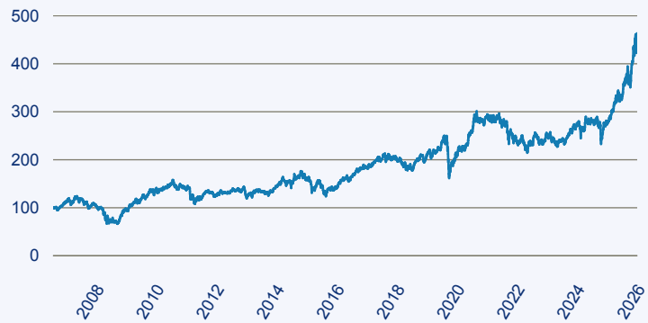
— Schroder ISF Global Emerging Market Opportunities EUR C ACC

Risiko: Die in der Vergangenheit erzielte Performance und die Erträge lassen keinen Rückschluss auf die zukünftige Performance und die Erträge des Fonds zu. Der Fonds ist weder mit einer Garantie noch mit einem Kapitalschutzmechanismus ausgestattet. Der in Euro umgerechnete Wert internationaler Anlagen des Fonds kann infolge von Wechselkursschwankungen (Währungsschwankungen) sowohl steigen als auch sinken. Der Wert des Fonds und damit der Wert ihres Investments kann gegenüber dem Einstandspreis steigen oder fallen.