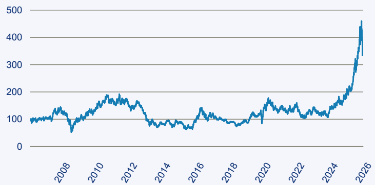
— BlackRock Global Funds World Gold D2

Risiko: Die in der Vergangenheit erzielte Performance und die Erträge lassen keinen Rückschluss auf die zukünftige Performance und die Erträge des Fonds zu. Der Fonds ist weder mit einer Garantie noch mit einem Kapitalschutzmechanismus ausgestattet. Der in Euro umgerechnete Wert internationaler Anlagen des Fonds kann infolge von Wechselkursschwankungen (Währungsschwankungen) sowohl steigen als auch sinken. Der Wert des Fonds und damit der Wert ihres Investments kann gegenüber dem Einstandspreis steigen oder fallen.