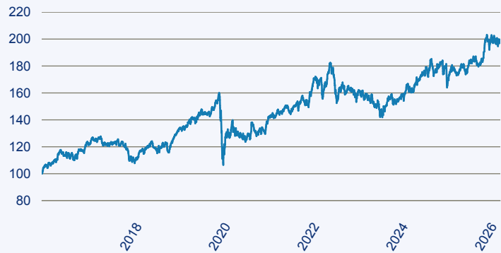
— First Sentier Global Listed Infrastructure Fund I (Accumulation) EUR

Risiko: Die in der Vergangenheit erzielte Performance und die Ertrage lassen keinen Ruckschluss auf die zukunftige Performance und die Ertrage des Fonds zu. Der Fonds ist weder mit einer Garantie noch mit einem Kapitalschutzmechanismus ausgestattet. Der in Euro umgerechnete Wert internationaler Anlagen des Fonds kann infolge von Wechselkursschwankungen (Wahrungsschwankungen) sowohl steigen als auch sinken. Der Wert des Fonds und damit der Wert ihres Investments kann gegenuber dem Einstandspreis steigen oder fallen.