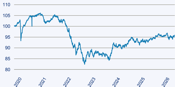
— Dimensional Global Core Fixed Income Lower Carbon ESG Screened Fund EUR A

Risiko: Die in der Vergangenheit erzielte Performance und die Erträge lassen keinen Rückschluss auf die zukünftige Performance und die Erträge des Fonds zu. Der Fonds ist weder mit einer Garantie noch mit einem Kapitalschutzmechanismus ausgestattet. Der in Euro umgerechnete Wert internationaler Anlagen des Fonds kann infolge von Wechselkursschwankungen (Währungsschwankungen) sowohl steigen als auch sinken. Der Wert des Fonds und damit der Wert ihres Investments kann gegenüber dem Einstandspreis steigen oder fallen.