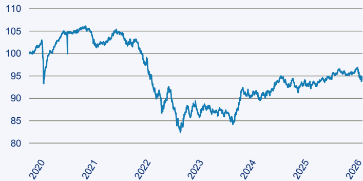
— Dimensional Global Core Fixed Income Lower Carbon ESG Screened Fund EUR A

Risiko: Die in der Vergangenheit erzielte Performance und die Ertrage lassen keinen Ruckschluss auf die zukunftliche Performance und die Ertrage des Fonds zu. Der Fonds ist weder mit einer Garantie noch mit einem Kapitalschutzmechanismus ausgestattet. Der in Euro umgerechnete Wert internationaler Anlagen des Fonds kann infolge von Wechselkursschwankungen (Wahrungsschwankungen) sowohl steigen als auch sinken. Der Wert des Fonds und damit der Wert ihres Investments kann gegenuber dem Einstandspreis steigen oder fallen.